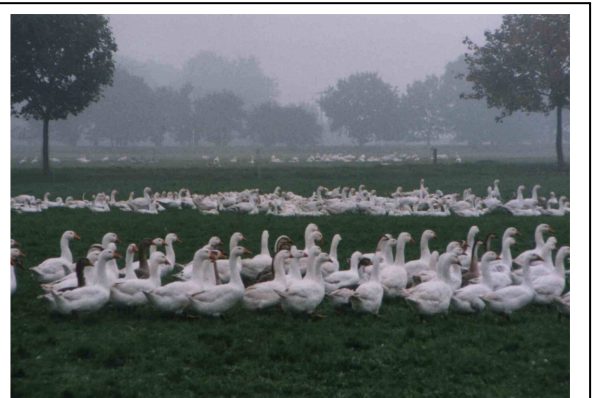
Weidemast mit einem Fleißgewässer ist für Gänse und Enten optimal.