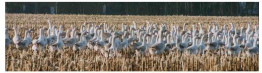
Diese Gänse eines Vermehrungsbe-triebs dürfen auf einem abgeernteten Maisfeld nachernten.

Besuchen Sie auch: www.tumev.de und www.aktion-kirche-und-tiere.de