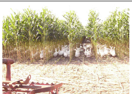
Geschützt durch einen umlaufenden Elektrozaun fühlen sich diese Mastgänse im Maisfeld sicher. Am Feldrand gibt es für sie eine große Wanne mit frischem, durchlaufendem Wasser.