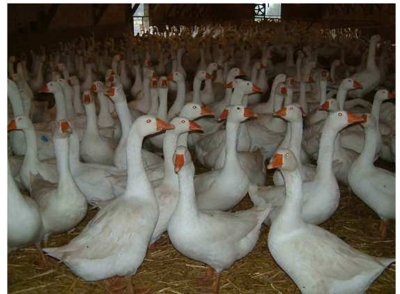
Stallhaltung von Wasservögeln ist Tierquälerei, denn Gänse (Foto) und Enten brauchen zur Gefiederpflege und zum Gesunderhaltung der Augen sowie ihrer Schleimhäute unbedingt sauberes Wasser.

Dass in einem Fall (Wermsdorf) die Puten in Stallhaltung erkrankten, während das Virus bei den Freilandgänsen nicht nachgewiesen werden konnte.