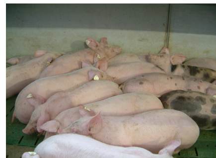
Mastschweine (Aufn. mit Blitzlicht)