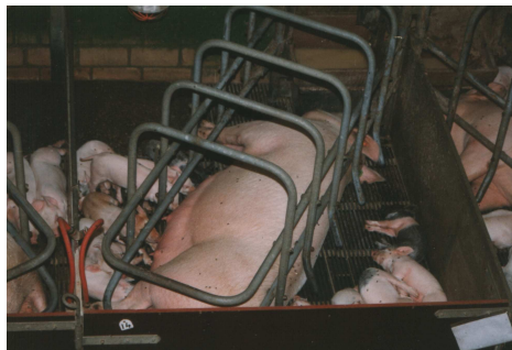
Sau mit Ferkeln in der Abferkelbucht